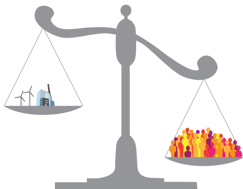
I södra Sverige råder stor obalans mellan behovet och tillgången av el